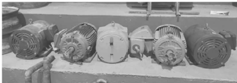
Lot de 5 moteurs (600 volts)