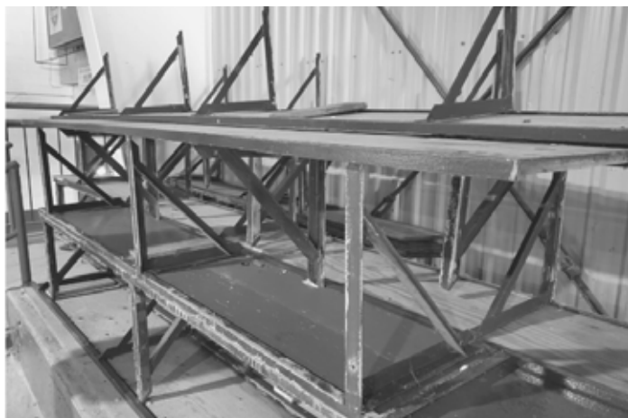
Bancs de joueurs