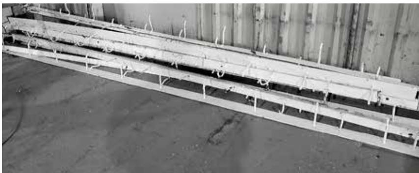
Crochets à vêtements