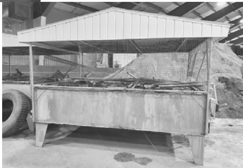
Lot de 6 fannes (600 volts)

Les soumissionnaires devront remplir un formulaire disponible à la Ville avant le 31 mars - 16 h. Les soumissionnaires devront faire un dépôt de 20 %. Ce dépôt sera remis s'ils ne sont pas choisis.