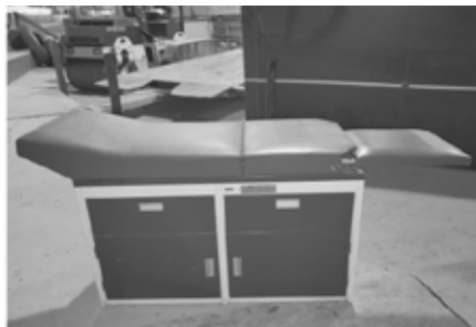
Table pour 1 ers soins