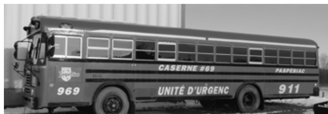
Autobus Prix plancher : 2 000 $