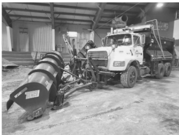
Camion Ford avec équipements la pelle à neige (45°), aile et boîte 4 saisons Prix plancher : 20 000 $