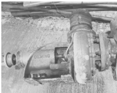
Lot de 5 pompes Prix plancher : 900 $ l'unité