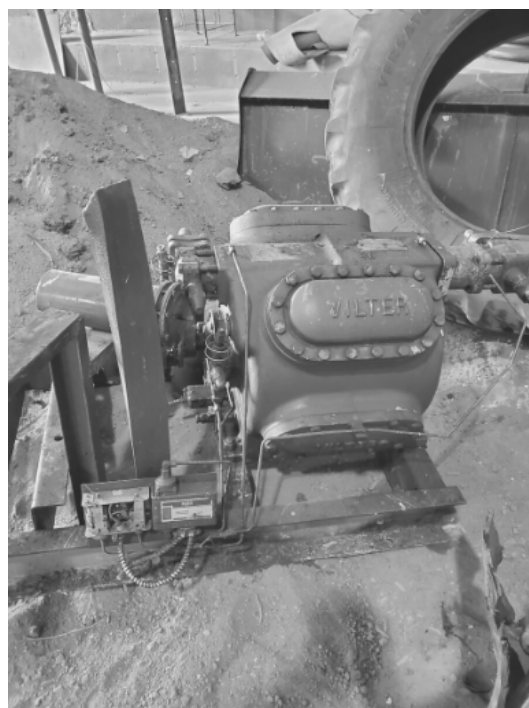
Lot de 4 compresseurs de 600 volts Prix plancher : 400 $ l'unité