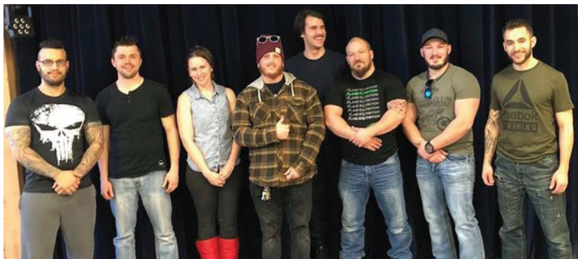
Sur la photo : Les personnes qui étaient présentes à l'AGA

Vous pouvez vous abonner au gym en vous présentant directement aux locaux du gym situés à l'avant de l'ancien aréna les jeudis et dimanches de 13 h à 16 h.